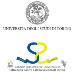
TAVOLA ROTONDA: AUTODETERMINAZIONE TERAPEUTICA